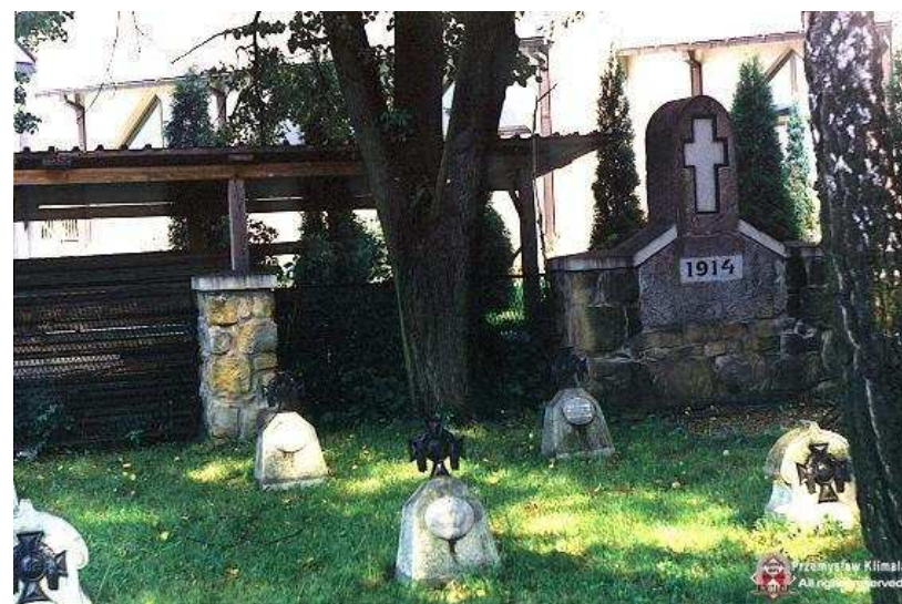
Dąbrówka (dzisiaj dzielnica Nowego Sącza) obok kościoła. Cmentarz został założony przy szpitalu wojskowym, który istniał w Dąbrówce podczas walk w 1914r. Większość pochowanych to Polacy, Węgrzy i Czesi