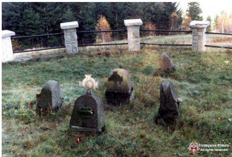
Cmentarz Stara Wieś - Golców. Cmentarz znajduje się na zboczu wzgórza Golców