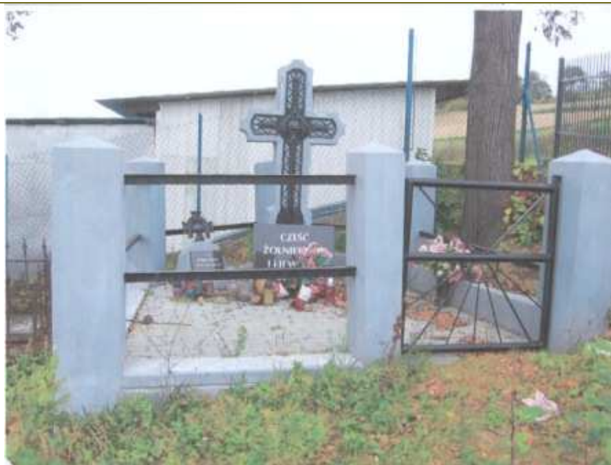
SIENNA Gmina: GRÓDEK NAD DUNAJCEM