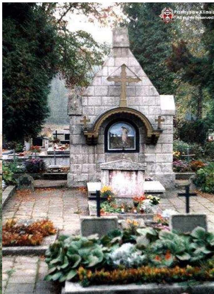
Cmentarz w Limanowej - mieści się na cmentarzu parafialnym. Mała kwatery wojskowa. Cmentarz nigdy nie osiągnął docelowego kształtu z powodu przeniesienia "punktu ciężkości" na Jabłowiec, który miał być bardziej reprezentacyjny