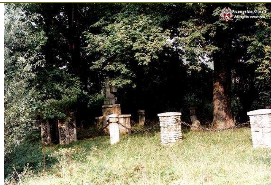
Cmentarz w Zabelczu gmina Nowy Sącz tuż za zjazdem z góry Zabałeckiej - przy betonowej drodze prowadzącej do wysypiska śmieci. Pośród drzew mały pomnik zwieńczony kamiennym krzyżem maltańskim.