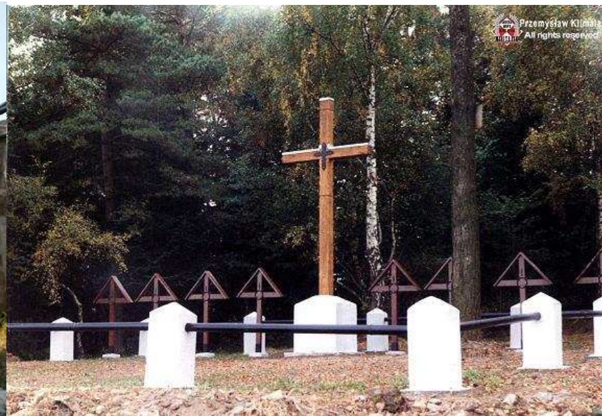
Cmentarz w Laskowej – na starym cmentarzu parafialnym. Jaworzna. Cmentarz wojenny na Korabie Na szczycie góry nad Kościołem w Jaworznie, tuż pod

lasem. Odbudowany i zadbane cmentarz, Z którego roztaczają się przepiękne widoki