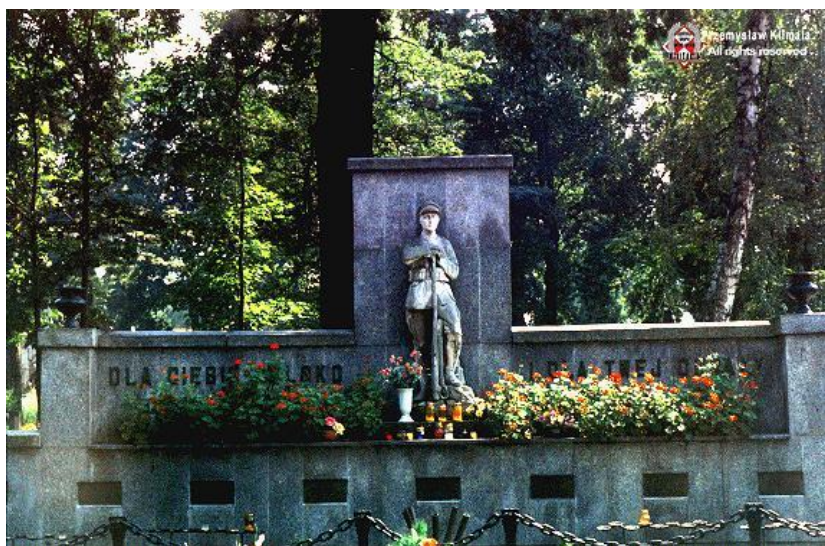
Nowy Sącz, Cmentarz Komunalny. Pomnik i miejsce pochówku 19 Legionistów poległych w walkach wokół Nowego Sącza. Na pomniku napis "Dla Ciebie Polsko i dla Twojej chwały 1914 - 1918"