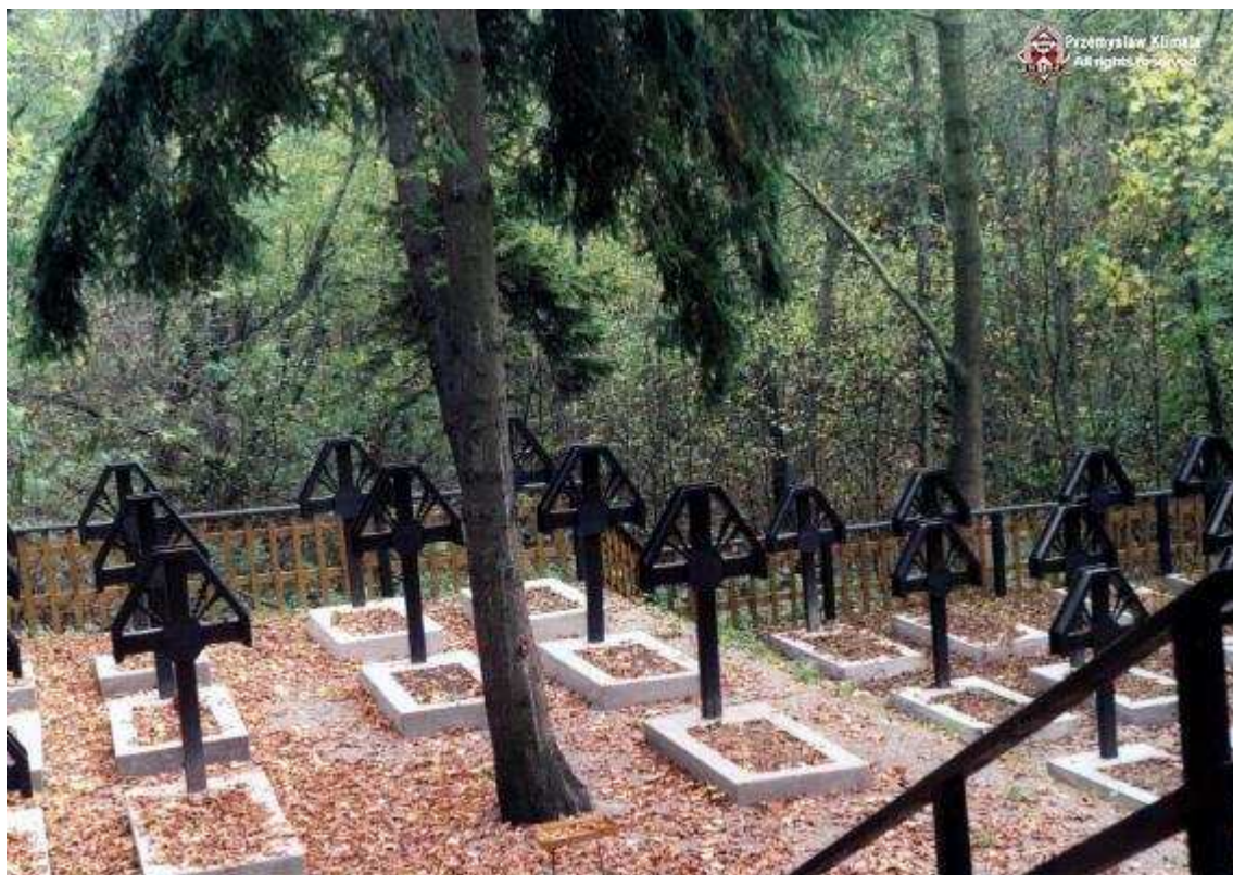
Cmentarz w Tymbarku - przy cmentarzu parafialnym. Rzadko spotykana w tych okolicach drewniana zabudowa – drewniane krzyże nagrobne oraz krzyż centralny. Cały cmentarz został odrestaurowany na początku lat dziewięćdziesiątych